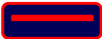
Cabo de Bomberos

El mando será identificado sobre el uniforme por un galón de pecho. Este galón mantendrá la siguiente composición y forma, así como corresponderá a la graduación que se le asigna: