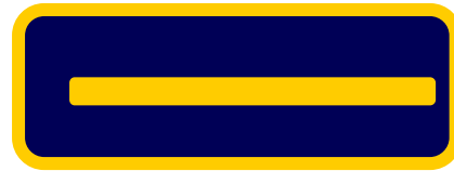
Oficial de Bomberos